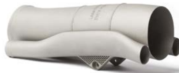
Formula 1 Lüfter