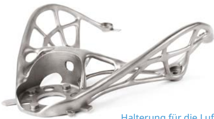
Halterung für die Luft- und Raumfahrt

Flexibel einsetzbarer Metalldrucker mit hohem Durchsatz und hoher Wiederholgenauigkeit zur Fertigung präziser Bauteile mit einer maximalen Bauteilgröße von 275 x 275 x 420 mm. Integrierte Lösung aus DMP Flex 350 Drucker, 3DXpert™ Software, getesteten LaserForm® Werkstoffen und der kompetenten Unterstützung unserer Anwendungsexperten. DMP Flex 350 kann jederzeit auf DMP Factory 350 mit integriertem Werkstoffmanagement umgebaut werden.