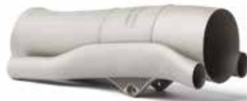
一级方程式排气管